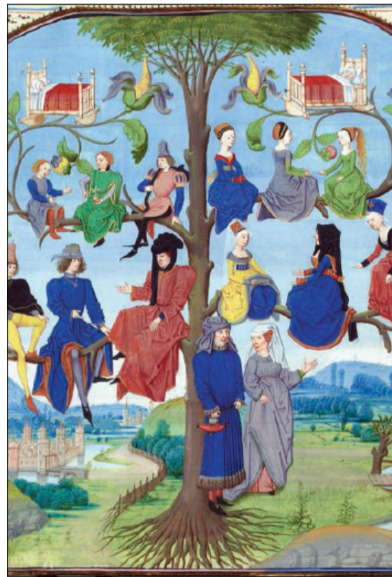
Miniatura di Loyset Liédet per il testo «La somme rurale» di Jean Bouteiller (XV secolo)