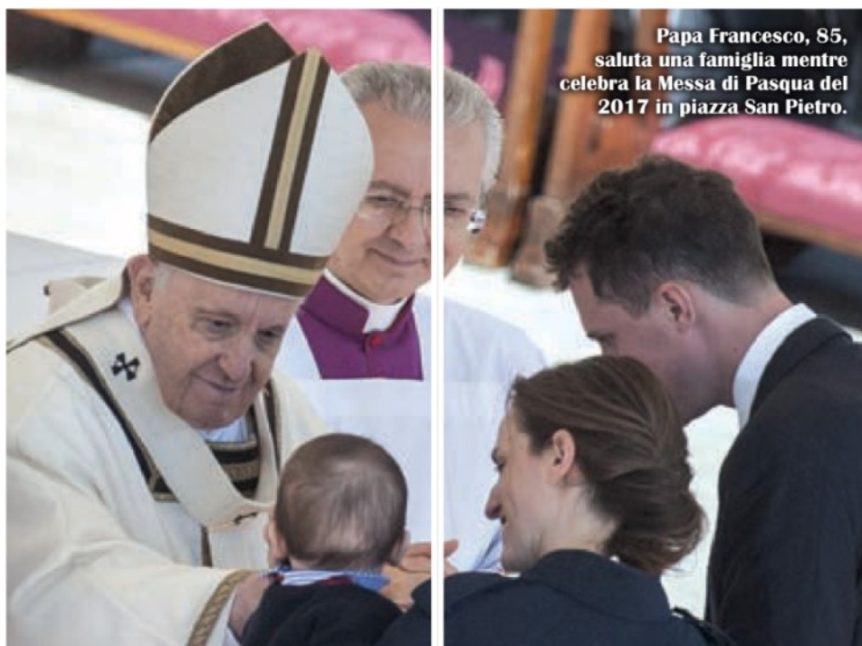
Papa Francesco, 85, saluta una famiglia mentre celebra la Messa di Pasqua del 2017 in piazza San Pietro.

si terranno nelle parrocchie di tutto il mondo durante l'Incontro di Roma. Tra i protagonisti un'ostetrica, una studentessa, un commercialista, o una comunità di famiglie... A ogni catechesi (disponibili sul sito www.romefamily2022.com ) sarà abbinato un utile video realizzato da Antonio Antonelli.