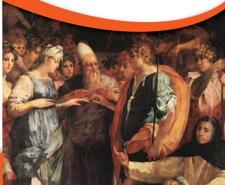
Immagine in copertina:

Giovan Battista di Jacopo, detto il Rosso Fiorentino, Sposalizio della Vergine (1523) , Firenze, Basilica di San Lorenzo.